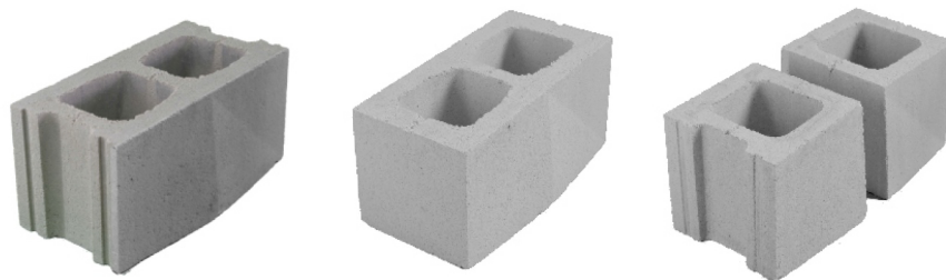
Bloque P.D. 20 X 40