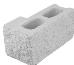
Esquina Split 15 x 40