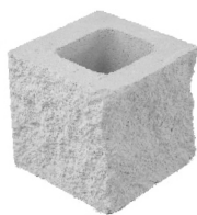
Medio dos caras vistas