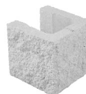
Dintel terminal, dos caras vistas.