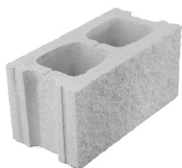
Bloque Split 20 X 40